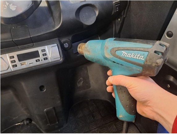
Sulata virtalukon kiinnitysliima. (kuumailmapuhallin).