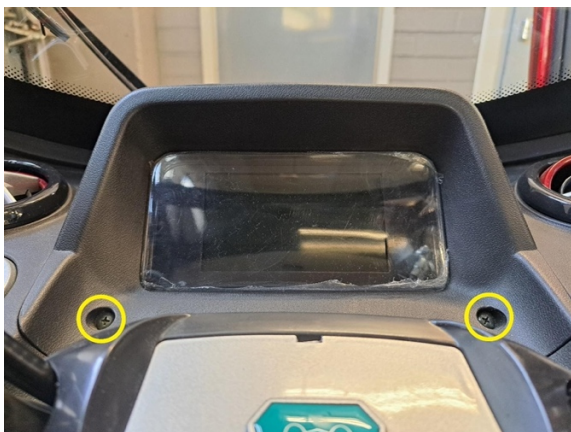
Irrota mittariston kiinnitysruuvit. (ristipäämeisseli ph2).