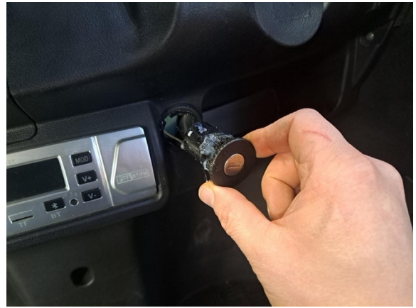
Ota virtalukko pois.

Uuden osan asennus käänteisessä järjestyksessä.