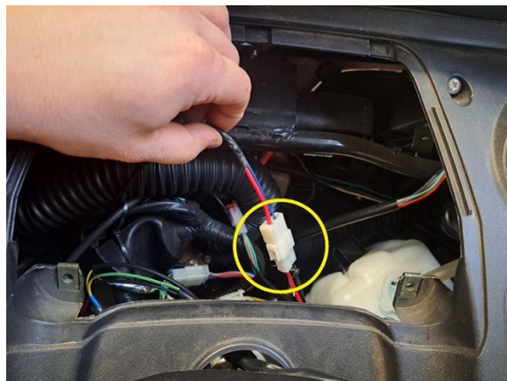
Avaa virtalukon liitin.